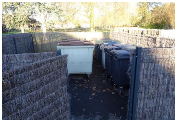
Local à poubelles du Mille-Clubs