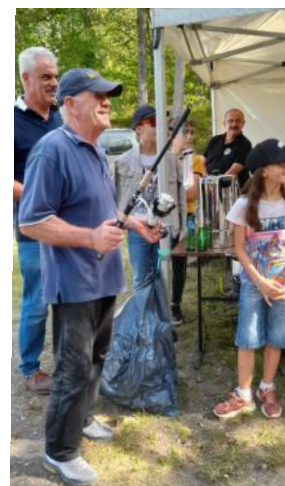
Le Gardon de Sologne.

Nous vous souhaitons de bonnes fêtes de fin d'année.