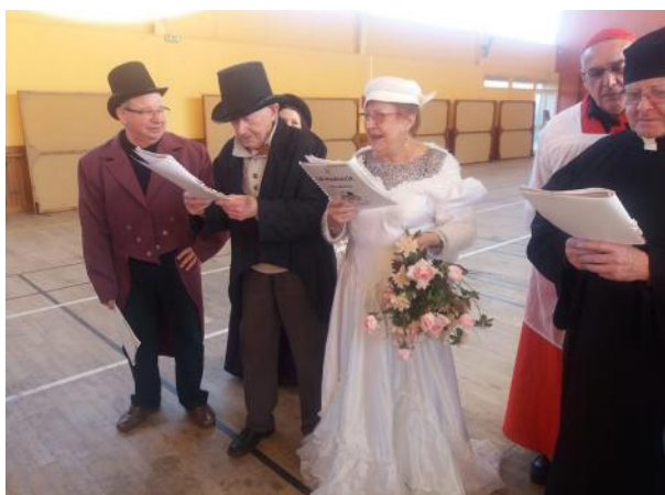
Le vrai faux « mariage » avec les copains

Dès lors, il s'implique dans la vie sociale du village, devient Président de plusieurs associations, dont il fait partie, et surtout de l'Amicale des Anciens Combattants.