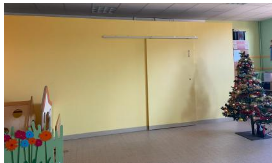
Agencement de l'école maternelle

L'entretien d'un village est une tâche énorme, compte tenu de la superficie du village et des kilomètres de chemins à entretenir.