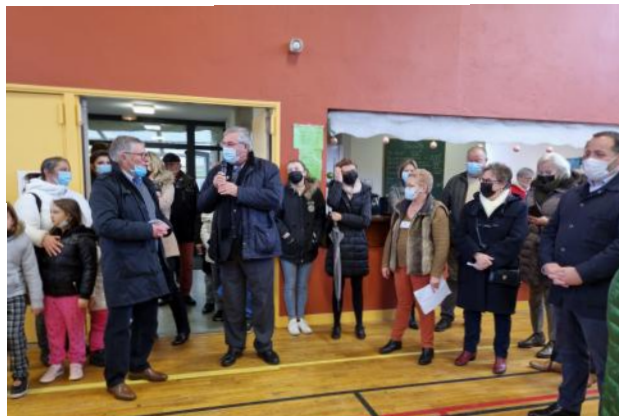
Inauguration du marché de Noël avec de nombreux invités élus

Ainsi les personnalités et la fanfare " Harmonie Sauldre et Sologne" ont inauguré ce marché à l'intérieur de la salle Jean Boinvilliers que nos bénévoles avaient décorée avec toujours autant de goût et dans une bonne ambiance.