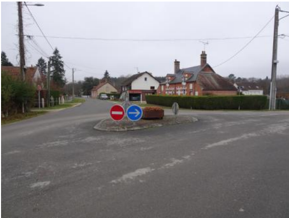
Place de la Jacque / chemin de Grandvaux