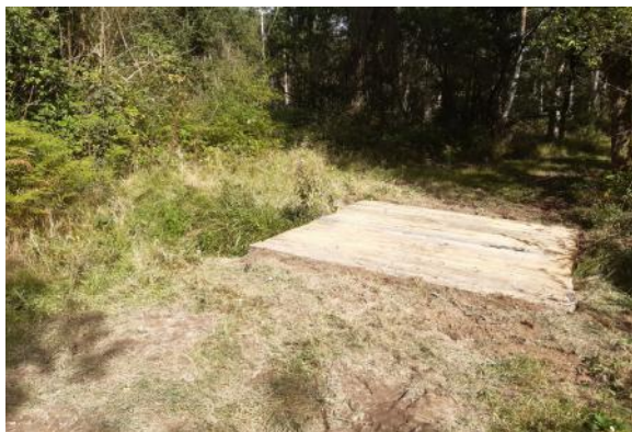
Passerelle du CR62

La patience est une vertu, l'arrogance un défaut.