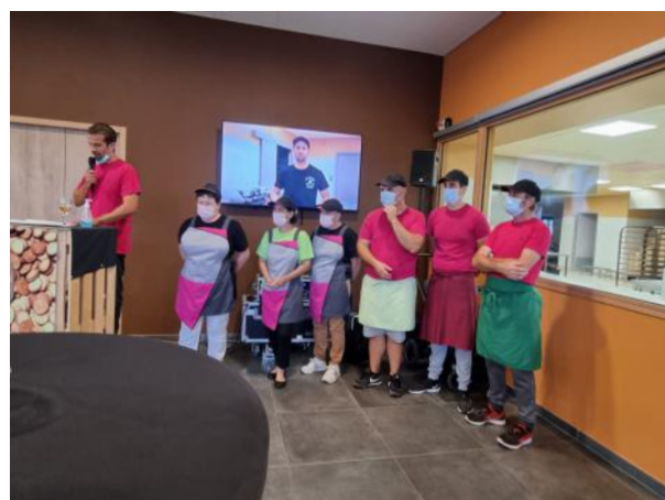
L'équipe de fabrication des sablés, dans les nouveaux locaux de fabrication et magasin fraîchement inaugurés.