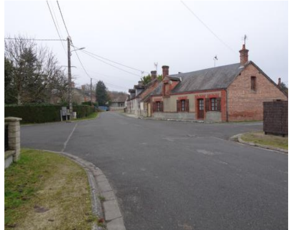
Croisement rue des Halles / Rue Sableuse