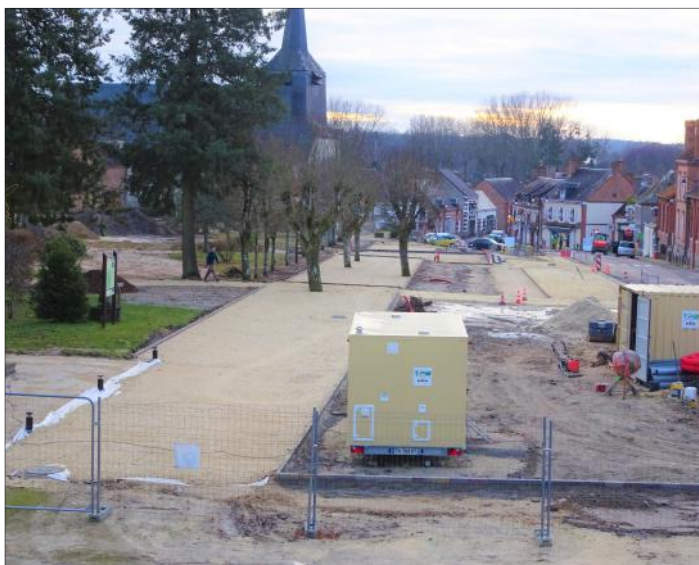
Travaux de revitalisation du Centre Bourg en photos