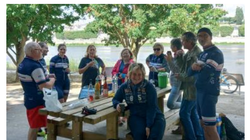
Randonnée des Bords de Loire

La saison cyclo-cross s'annonce excellente pour le CCB, qui compte déjà un titre, plusieurs victoires et podiums.